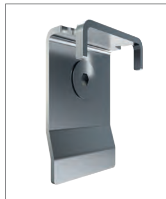
Die Adapter können in LED-Panels unterschiedlicher Hersteller geschraubt werden.